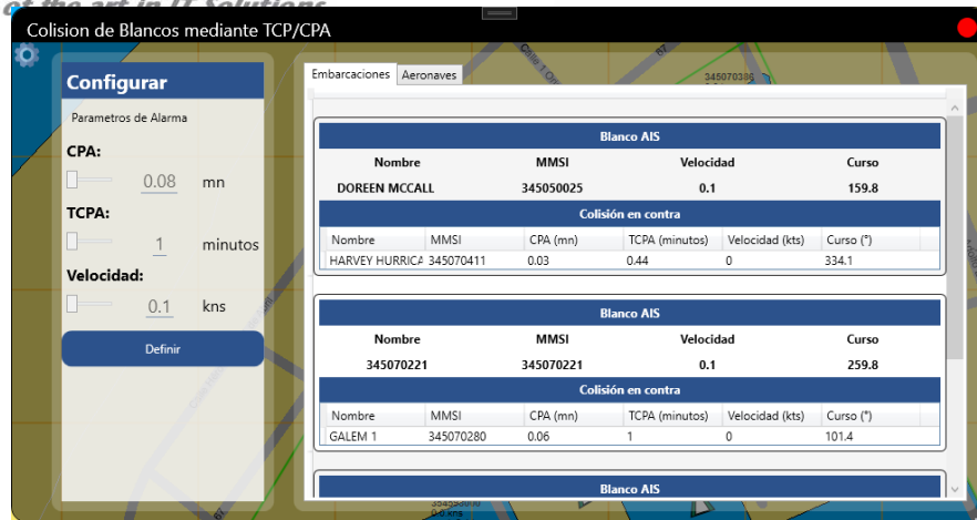
Ilustración 3 información de colisiones CPA y TCPA