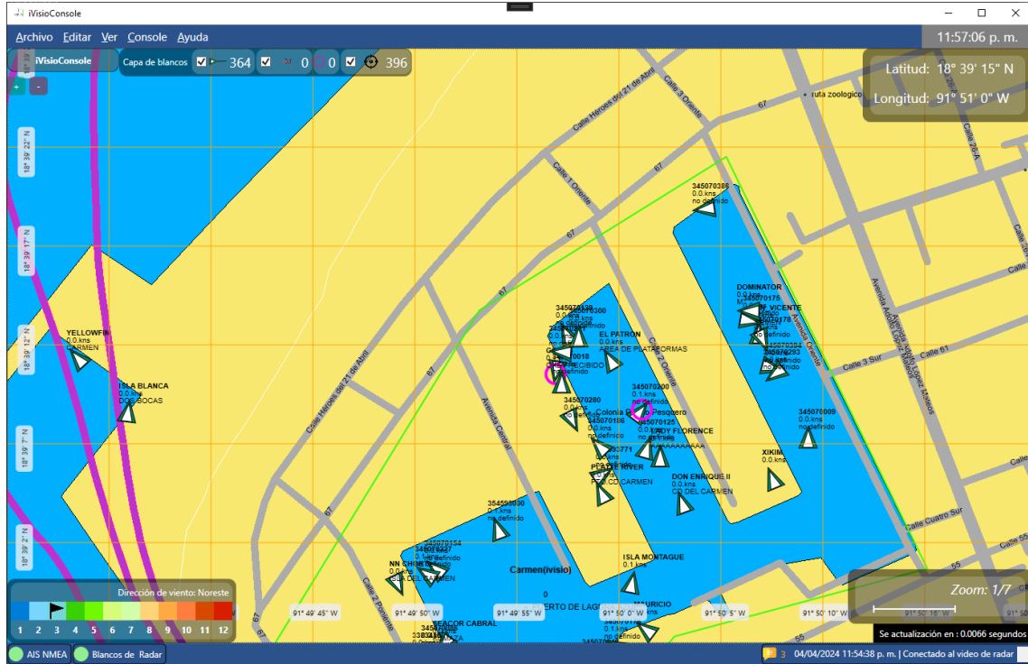
Ilustración 1 Alarma de colisión CPA y TCPA en carta náutica

En iVisioConsole se puede visualizar la alarma de colisión por CPA y TCPA en la carta náutica y en un tabulador. En la siguiente imagen se muestra un ejemplo de alarma CPA y TCPA en la carta náutica: