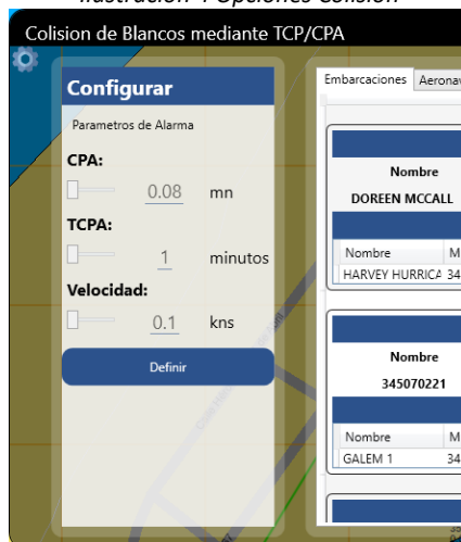
Ilustración 5 Configuración de alarma